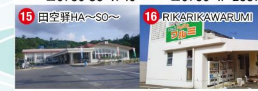
15 田空驿 HA~SO~ 本部町字志坚1334 营业时间：9:00~17:00 定休日：星期二 ☎0980-48-3835