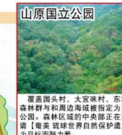
山原国立公园 覆盖国头村、大宜味村、东村的森林群与周边海域被指定为国立公园。森林区域的中央部正在申请【奄美琉球世界自然保护遗产】为目标而努力着。