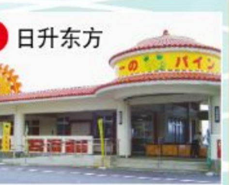
9 日升东方 东村字平良550-23 营业时间：9:00~19:00 ☎0980-43-2270