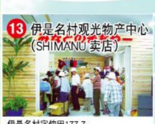
13 伊是名村观光物产中心 (SHIMANU 卖店) 伊是名村字仲田177-7 ☎0980-45-2781