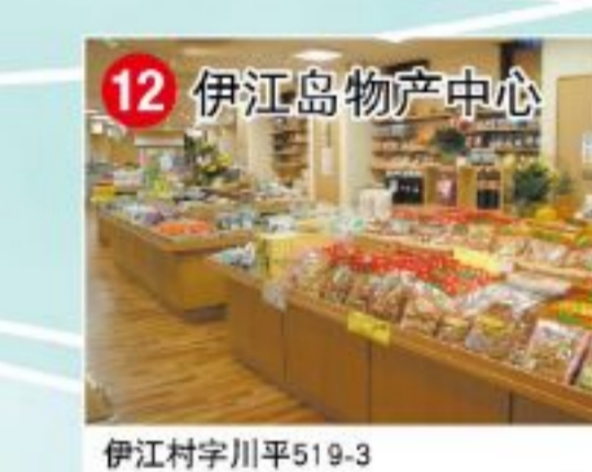
12 伊江岛物产中心 伊江村字川平519-3 营业时间：7:00~16:00 定休日：全年无休 ☎0980-49-5555