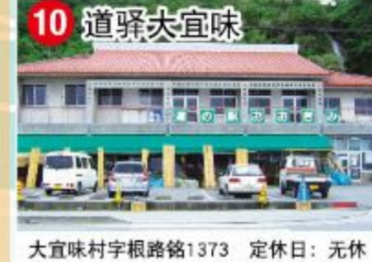
10 道驿 大宜味 大宜味村字根路1373 定休日：无休 营业时间：8:30~17:30 (因店铺而异) ☎0980-44-3048