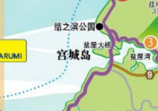
大宜味 置路海岸 ☎0980-44-3048