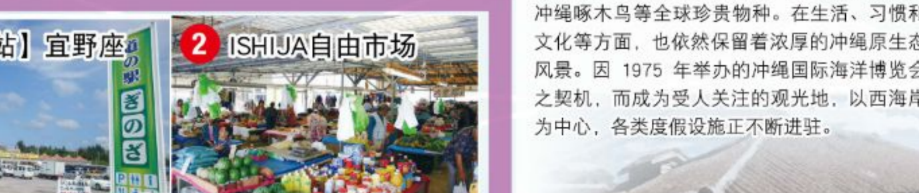
2 ISHIJIA自由市场 金武町字金武8223-5