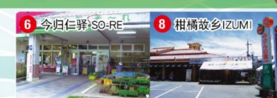
6 今归仁驿 SO-RE 今归仁村字玉城157 营业时间：9:00~18:00 定休日：星期一 ☎0980-56-4940