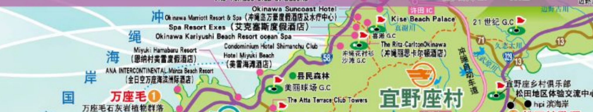
3 道驿 宜野座 宜野座村字汉那1633 营业时间：9:00~19:00 定休日：无休 ☎098-968-4520