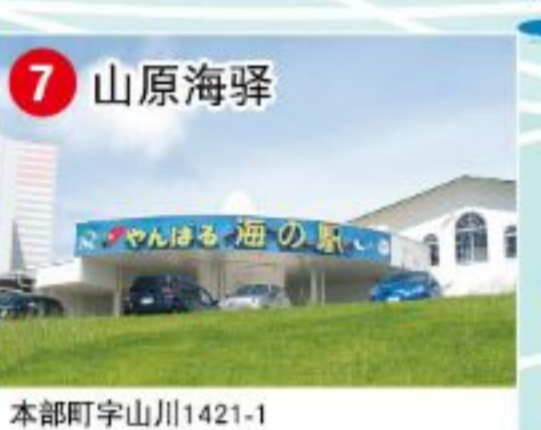
7 山原海驿 本部町字山川1421-1 营业时间：7:00~22:00 定休日：全年无休 ☎0980-48-4539