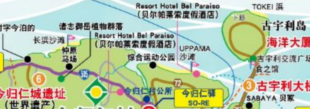
16 RIKARIKAWARUMI 今归仁村字天底1124-5 营业时间：9:00~18:00 定休日：无 ☎0980-56-1223