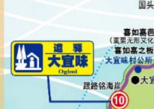
大宜味 置路海岸 ☎0980-44-3048