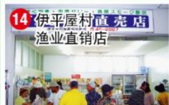
14 伊平屋村直売店 渔业直销店 伊平屋村字我高屋217-70 营业时间：7:30~9:30, 11:30~17:30 定休日：无休 ☎0980-46-2027

冲绳最具代表性的度假设施集中的西海岸，以及与此相对的东海岸。新旧交错、西式和日式或琉球风格彼此交融，各种各样的人在此地区交汇，拥有着造就了山原多样性的有趣地区。不论是几个人出游还是旅游团，在此都能享受到丰富多彩的魅力体验项目，如文化体验、农业体验等。